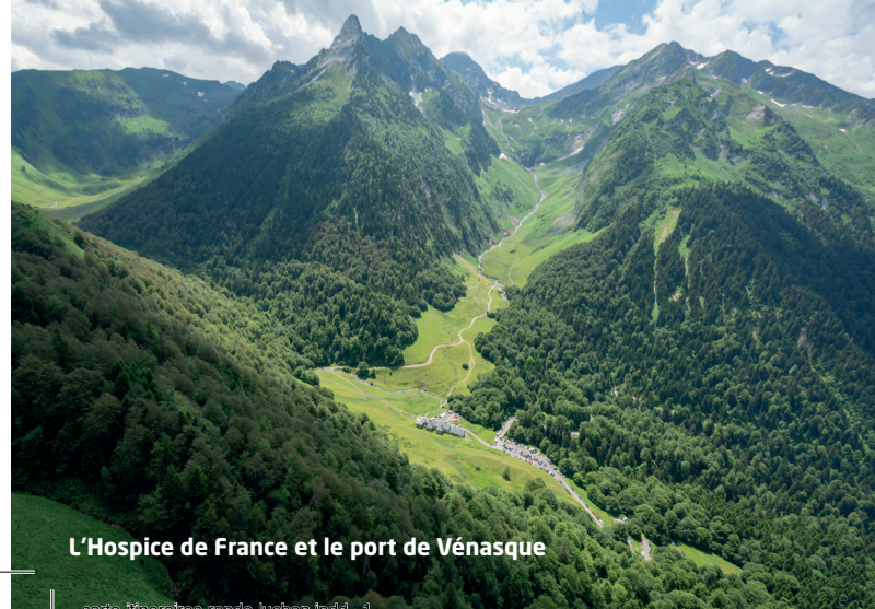
L'Hospice de France et le port de Vénasque