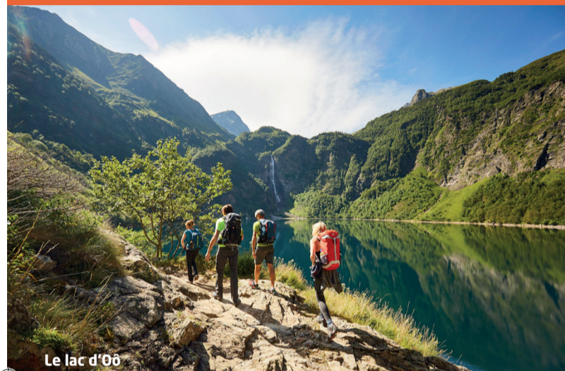
Le lac d'Oo