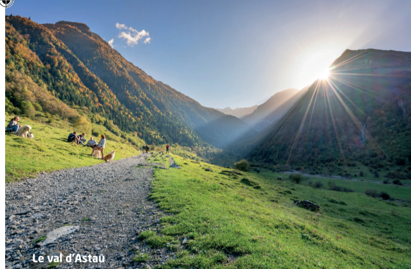
Le val d'Astau